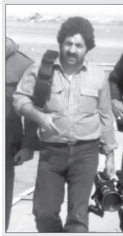
به یاد صراط میهن