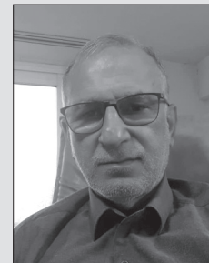
علی قلی تبار

حضرت سعدی، علیه الرحمة از نادر مفاخری است که ذوابعاد و متنوع، به امور اربعه ی زیستی یعنی سیاسی، فرهنگی، اقتصادی و اجتماعی، توجه دارد. در حوزه های اخلاقی و تربیتی و عشق و مودت نیز، آثاری زندگی ساز در بوستان و گلستان از او در دسترس است. بنابراین همه ی سطوح و فرهنگ‌ها و طبقات و اصناف می‌توانند سفره خور خوان فضیلت باشند. شوربختانه، در میان محافل و سبدهای هزینه ی ما کتاب و آثار مکتوب، نشانی ندارد و با غلبه ی شبکه های مجازی بر فرصت های حضوری و فیزیکی، کتاب، نه مغفول که مهجور ماند. در چنین شرایطی، مولوی و حافظ و سعدی و عطار و ... به فراموشخانه واگذار می‌شوند. از جمله نکات بسیار مهم در نظر حضرت شیخ اجل، تمرکز بر سیاست و امارت و رابطه ی میان سلطان و رعیت به تعبیر اوست. نظر به اهمیت این نگره، به فضل الهی، طی چند نوبت بدان خواهم پرداخت. شیخ اجل در نخستین باب گلستان که در سیرت پادشاهان است، و هم‌چنین، باب اول بوستان که در زمینه ی هوش و تدبیر و رأی سخن رفته، آیین مملکت‌داری و ویژه‌ای پیش نهاد می‌کند. پاسداری، رفاه مردم، تأمین امنیت، نظام استخدای، تدابیر جلب مسافر و جهانگرد، نظارت بر کارگزاران، آموزش‌های شغلی، دادورزی، حق‌پذیری، نصیحت‌نویسی و آیین جنگ و تدبیر سپاه را به روشنی بیان و با آوردن داستان‌های مناسب، مطالب را رساتر می‌کند؛ و نیز ژرف‌نگری در اخلاق و رفتارهای انسان‌ها، تعمق در احوال دوستان و دشمنان و دقت در کنش‌ها و واکنش‌های متقابل آنان به طور طبیعی، سعدی را متوجه مبانی و موضوع‌ها