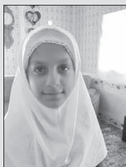
بهار جام خورشید