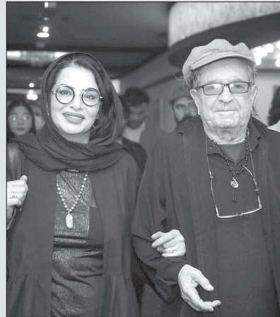
سرنوشت خود می شورند و می تازند تا به خود آیینی و استقلال دست یابند. آنها در ژرفای تنهایی خود را می آفرینند نیکوست در همین جا یادای کنیم از همسر و همراه زندگی مهرجویی؛ شادروان وحیده محمدی فر که

محمد رضا ارشاد_ نخستین بار در سال ۱۳۶۸ "هامون" مرا به جهان سینمایی مهرجویی فرا خواند. سرگشتگی و بی در کجایی و سامان ستیزی هامون و مهشید برای من که در آن سالها در میدان اندیشه ها و آوردگاه ایده نولوژی های گوناگون و رنگارنگ چمان و دوان از این سو وان سو بودم پژواکی آشنا داشت گرچه بینش عرفانی فیلم مرا خوش نمی آمد. این گونه بود که مهرجویی آینه خواستها و نگرانیهای روشنفکرانه و هامون نماد و گونه ( تیپ) روشنفکری روزگار ما گردید. شورمندانه به جست و جوی فیلمهای دیگر او برآمدم اما دیری نپایید که پی بردم سینمای او پیش و بیش از آن که روشنفکرانه زبانه اجتماعی، سیاسی و... باشد، سینمای زندگی است. او آمیزه ای از، رنوار، وایلد، برگمان، فلینی، بونویل، انتونیونی، تروفو، گدار، وودی آلن و برسون بود، اما باز خود مهرجویی بود. مهرجویی کاراکترهای سینمایی خود را از بستری سراسر اگزیستانسیال (وجودی) بر می گزید و آنها را در بوته رویارویی با آزمونهای تنش زا و دشوار روزگار می نهاد تا آبدیده و پرورده شوند. قهرمانهای او بویژه زنان بر