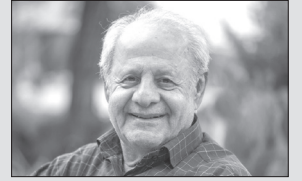
مهدی سیف حسینی

و عمل اشاره می کند و می گوید: معنای زندگی در تحقق کمالات انسانی است. ملاصدرا دیگر فیلسوف ایرانی را نظر به این است که معنای زندگی در رسیدن به خداوند و تحقق هدف اصلی خلقت است. برای ملاصدرا، زندگی در واقع یک سفر است که انسان باید در آن به سمت خداوند حرکت کند و با توجه به فضیلت ها و ارتباط با خدا به معنای زندگی دست یابد. او به اهمیت عقل و عشق توجه دارد و می گوید: باید با یکدیگر تعادل و هماهنگی داشته باشد و همچنین می گوید: عقل قادر به شناخت حقیقت های عالم است و عشق قادر به رسیدن به خداوند و تجربه معنوی، لذا تعادل بین عقل و عشق برای رسیدن به معنای زندگی ضروری است. مولانا معتقد است، برای اینکه انسان دریافت درستی از معنای زندگی داشته باشد، باید خود را بشناسد، آنگاه است که می فهمد هستی و خدای هستی همه در اوست. گنج و گنجینه ای که انسان به دنبالش می گردد، نفس اوست. اشتغال به لذات زودگذر شهوانی و دنیوی همه ناشی از آن است که خود را شناخته است. در اندیشه مولانا مقصود از معنای زندگی، اتصال به معشوق حقیقی و سرچشمه کمالات و منابع آن خودشناسی و خودکاوی و راه رسیدن به آن، سعی و تلاش است.