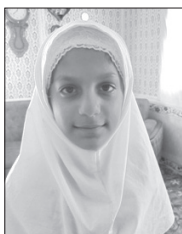
بهار جام خورشید

این روزها امن یحییب بخوانیم برای دل هایشان و برای اتمام تمام جنگ های جهان برای مظلومان و کودکان، دعا کنیم که کاش بیاید تنها امید ما، امام زمان (عج) اللهم عجل ولیک الفرج