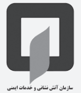
سازمان آتش نشانی و خدمات ایمنی