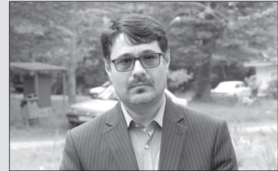
حسین دوست محمدی

در عرف کنش سیاسی بویژه در فعالیتهای انتخاباتی حضور افراد سرشناس باعث ایجاد هیجان و شوک انتخاباتی می شود اما در اتفاقی نادر در استان گلستان عدم حضور یکی از چهره های سرشناس استان در انتخابات مجلس خبرگان رهبری خبر ساز شده است. آیت الله سید کاظم نورمفیدی نه در سطح استان که در سطح کشور چهره شناخته شده ای است و مردم او را به عنوان یکی از روحانیون خط امامی، اصلاح طلب، معتدل و نوگرا می شناسند، لذا نیاز به معرفی ایشان نیست. تنها مسئله ای که اکنون درباره ایشان حائز اهمیت خبری و سیاسی است داستان عدم شرکت ایشان در انتخابات مجلس خبرگان است که بنا داریم در این مجال اندک به آن بپردازیم. عدم اقبال آیت الله نورمفیدی به انتخابات مجلس خبرگان شاید دلایل متقنی داشته باشد اما در نگاهی ژورنالیستی به موضوع و در چارچوب تحلیل سیاسی می توان این دلایل را به ۳ دسته تقسیم بندی کرد: