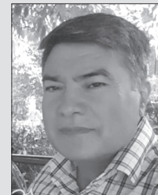
نورالدین سن سبلی

این حکایت که در دفتر دوم آمده است، همه مختصات زبانی و فکری مولانا را دارا است و شاید زیباترین داستان مثنوی باشد. اگر کسی تنها همین داستان را از مثنوی بخواند، مهم‌ترین و محبوب‌ترین آموزه عرفانی مولانا را دانسته و نیز با بیشتر مهارت‌های زبانی آن سلطان شگرف آشنا شده است. مولانا در این داستان، هم طنز آورده و هم تغزل کرده و هم پرده از راز دین برداشته و هم مرام‌نامه ایمان وجودی را در داستانی دلکش به نظم کشیده است. دکتر سروش در کتاب قمار عاشقانه، این داستان را احسن القصص مثنوی خوانده و شرحی نیکو بر آن نوشته است. داستان موسی و شبان مثنوی، از جهتی دیگر نیز سزاوار درنگ است: مخالفان مولوی، این داستان را فراوان نکوهیده‌اند. من نخست گمان می‌کردم که تنها دلیل مخالفت‌ها، تقابل قهرمان داستان (چوپان) با پیامبری بزرگ (موسی) است. اگر هر داستانی، قهرمانی داشته باشد، بی‌شک قهرمان این داستان چوپان ساده‌دل است، نه موسی. در نهایت نیز خدا طرف شبان را می‌گیرد و موسی را سرزنش می‌کند که چرا «بنده ما را ز ما کردی جدا؟» دوستداران مولوی می‌گویند: