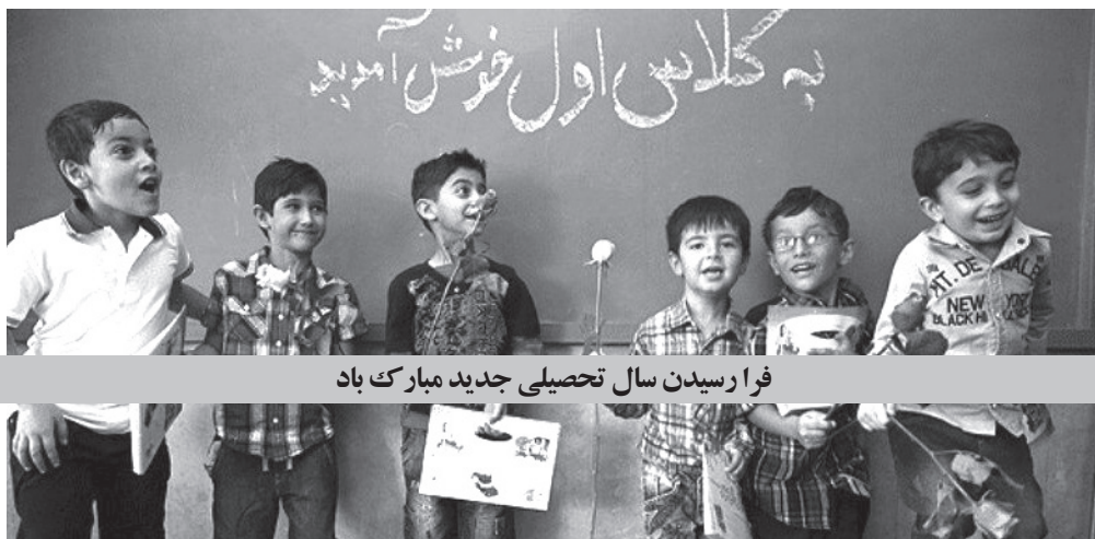
فرا رسیدن سال تحصیلی جدید مبارک باد