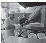
۱۳۵ نانوائی کلاه دوگانه سوز شدند