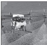
سه دهک اول در اولویت دریافت تسهیلات خرید پهپاد کشاورزی