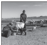
تخصیص وام پروار بندی و اشتغال به عشایر گلستان