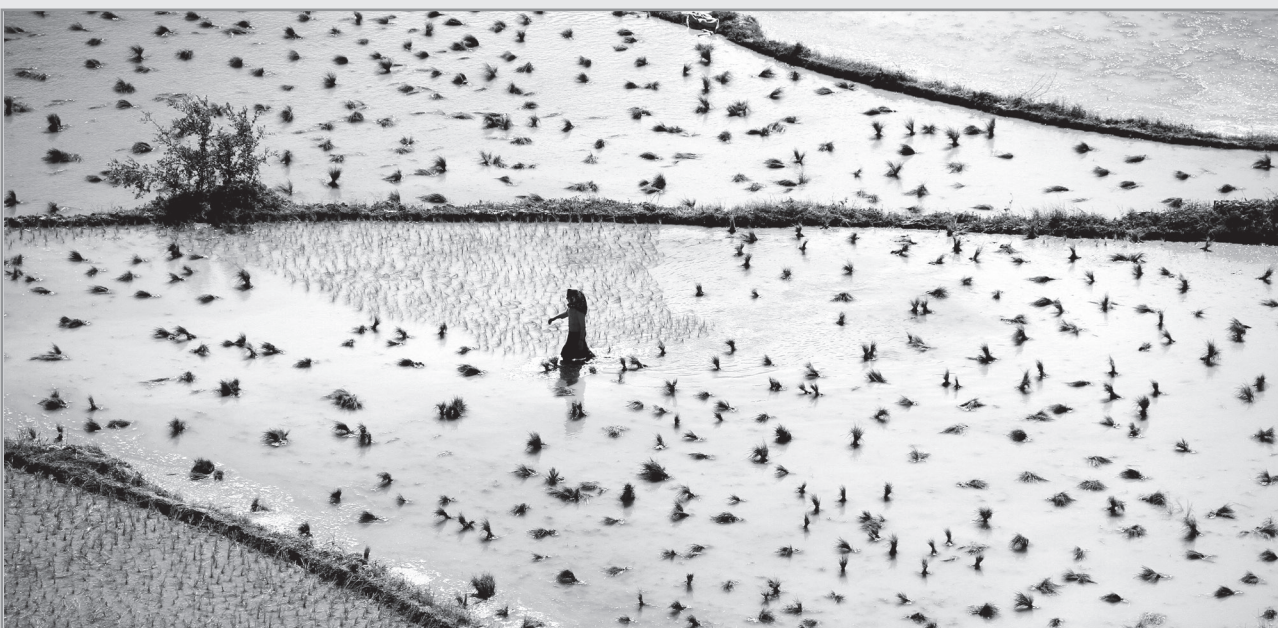
شیرازهای گلستان

محوریت توسعه آبی راهها است و به همین دلیل، صدور بعضی از مجوزها، با کاربردهای خاص در حریم راهها همخوانی نداشته و لازم الاجرا نخواهد بود. به گفته وی، هرگونه خرید و فروش زمین و تغییر کاربری در حریم راهها نیازمند دریافت استعلام مثبت از اداره ایمنی و حریم راههای اداره کل راهداری و حمل و نقل جاده ای است که باید قبل از هر استعلام دیگری از سوی ارگان هایی همچون سازمان همیاری شهرداری ها، دهیاری ها، شهرداری ها، جهاد کشاورزی و غیره دریافت شود.