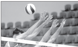
اردوهای استعدادیابی والیبال گلستان آغاز شد

زمین های بازی و تمرین مجموعه ساحلی بندر ترکمن، محل اسکان، کادر اجرایی و مدیریتی والیبال این استان و دیگر ظرفیت های موجود برای میزبانی چنین مسابقاتی، نشان می دهد این استان می تواند میزبان تورهای جهانی دو ستاره و حتی سه ستاره والیبال ساحلی باشد