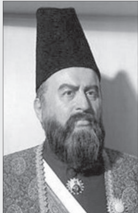
■ امیر کبیر