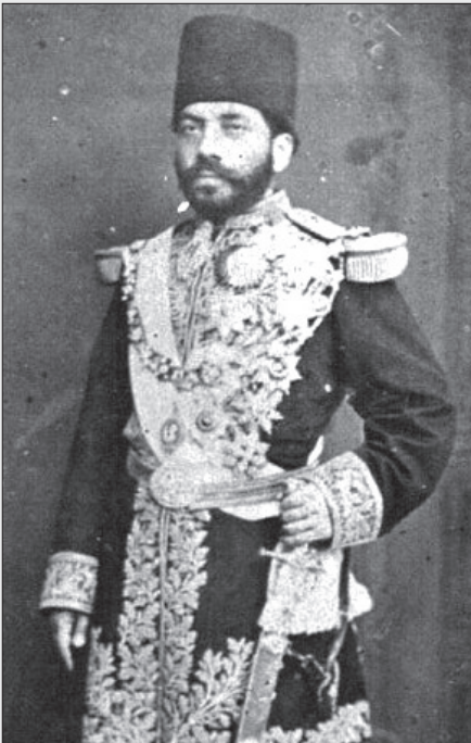
میرزا حسین خان سپه سالار

که بر زبان عباس میرزا جاری شد، آغازی بود برای شکل گیری روند خودکم بینی ایرانیان که هنوز بعد از دو قرن، با وجود دستاوردها، تغییرات و تحولاتی که کشور تجربه کرده، ادامه دارد. کافی است سری به کاتالها و صفحات موجود در فضای مجازی بزنید، به وفور می بینید متونی با طنز تلخ و محتوای "فقط تو ایرانه که"، "فقط به ایرانی میتونه" و "وطنم پاره تنم" مملکت داریم و... دست به دست می شوند. نمی دانیم میل به خودزنی ملی و فرهنگی از کجا آمد و چه شد که اعتماد به نفس جمعی یک جایی آن اشتیاق فراینده به ملیت و کوروش در می آمیزد با سفر به خارج از کشور و باختن احساس غرور ملی و وارد شدن به فرایندی از خودتخریب گری ملی در تبیین این موضوع می توان گفت: احساس غرور ملی بیشتر از جنس دفعی، ناگهانی، احساسی و عاطفی است. متأسفانه در سال های اخیر حس ملیت خواهی و غرور ملی گرای را به صورت واکنش دیده ایم. ملیت خواهی و ملی گرای دقیقاً مثل پناهگاه عمل می کنند؛ همان کاری که دین هم انجام می دهد.