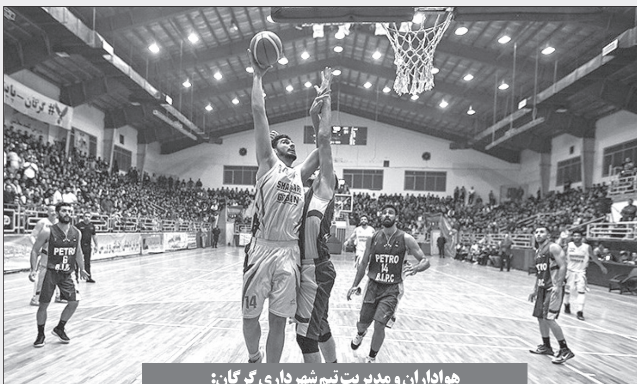
هواداران و مدیریت تیم شهرداری گرگان: