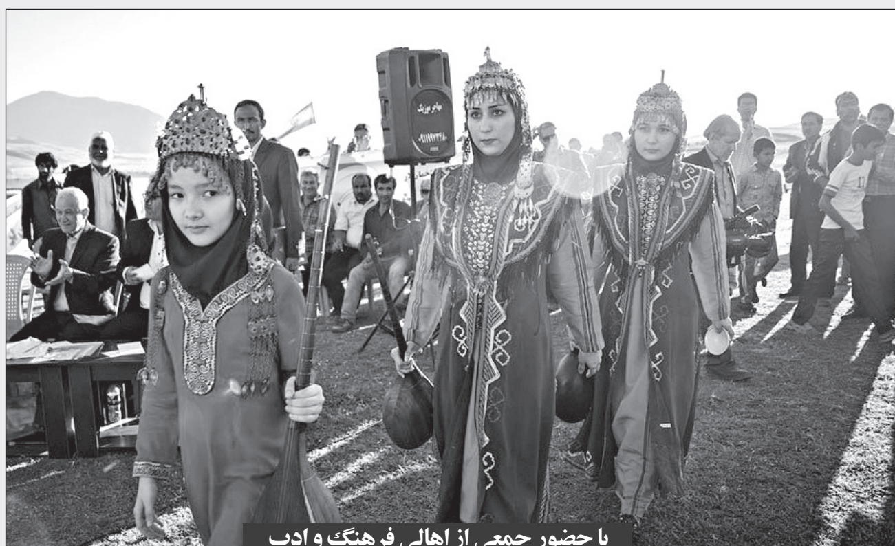
با حضور جمعی از اهالی فرهنگ و ادب

آغاز دوباره سفر به تفرجگاه ها و مناطق بیلاقی، کنار گذاشتن استفاده از ماسک و دستکش توسط شهروندان در کنار کم توجهی به رعایت پروتکل های بهداشتی، تصاویر روزهای اخیر گلستان؛ صد روز پس از مشاهده اولین نشانه های کرونا است که اصرار بر انجام این رفتارها، احتمال همه گیری دوباره این بیماری را افزایش می دهد. به گزارش ایرنا، اولین رد پای کرونا اسفند پارسال در گلستان مشاهده شد و از آن روز تاکنون مردم این استان همانند دیگر مناطق کشور گرفتار همه گیری کرونا و راه های نجات از به خطر افتادن جان خود هستند اما گویی این هشدارها آرام آرام در حال رنگ باختن است. مشاهدات نشان