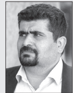
■ شبیر دائمی

اگر در محل کار عقربه های ساعت اتاقتان سنگین حرکت می کنند، یا ثانیه ها هرگز به پایان ساعت اداری نمی رسند و یا اصلا دلتان نمی خواهد ارباب رجوعی به سراغتان بیاید، متاسفانه باید بگویم شما از کارتان استعفا داده اید. درست است که شما استعفا قانونی و اداری نداده اید، اما