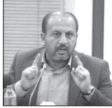
رفع چالش های اقتصادی نیازمند همصدایی است