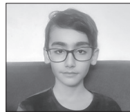
● برای کودکان غزه

صبح یک روز بهاری وقتی آهو خانم از خانه اش بیرون آمد، متوجه شد که مردم سه دهکده (دهکده ی درخت کاج، دهکده ی آبشار دو طبقه و دهکده ی گل رز) تصمیم گرفتند که مدرسه ای بسازند برای تمام پایه ها تا محصلین مجبور نباشند به شهر بروند و برگردند. آهوی ما به خانه اش رفت و فکر کرد که یعنی مدرسه ی جدید چه شکلی خواهد بود؟ آیا مدرسه حیاط دارد؟ آیا مدیر دارد؟ و ... چند روز بعد، وقتی آهو خانم داشت از بین سه دهکده می گذشت متوجه این شد که مدرسه ای در آنجا بنا شده! آهو چشمانش برق می زد و با هیجان داشت مدرسه را بررسی می کرد که دید پروانه ای دارد وارد حیاط مدرسه می شود و از آنجایی که آهو خانم خیلی پروانه ها را دوست داشت به دنبال پروانه رفت. پروانه و آهو از حیاط مدرسه گذشتند و بچه هایی را دیدند که در صف ایستاده اند و آهو دوان دوان به سمت پروانه رفت که به کمدهای رختکن باشگاه کوچک مدرسه رسید و پروانه درون یکی از کمدهایی رفت که دریش باز بود و آهو هم به دنبال پروانه رفت و درب کمد ناگهان بسته و قفل شد! آهو خانم که از دست و پا زدن خسته و ناامید بود چشمش به یک عکس و بعد یک نوشته افتاد. در آن کاغذ نوشته بود که: «در نزدیکی خانه ی ما در دهکده کاج آهوئی زندگی می کند که خانه اش نزدیک قارچ هایی است که ما پرورش می دهیم». آهو به زبان خود می گوید: «یعنی قارچ هایی که خیلی خوشمزه بودند و می خوردم. قارچ های آنها بود؟» و بعد پروانه پیش عکس رفت و آهو گفت: «حتما می خواسته عکس مرا بگذارد که از خواهر دو قلویم عکس گرفته! یعنی ما حیوانات اینقدر با هم شباهت داریم؟» که در کمد باز شد و دخترک جیغ بلندی زد و آهو را ترساند ولی او می خواست آهو را به دوستانش نشان دهد!