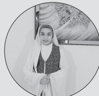
ویانا روح افزایی

توی جنگل بزرگ زیبا برکه ی کوچک وجود داشت که یک ماهی کوچولوی زیبای قرمز تنها زندگی می کرد. این ماهی قرمز