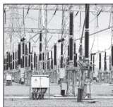
تأمین زیر ساخت های برق اولویت توسعه گلستان است

عید قربان عید نور و بندگی بر همه مسلمانان مبارک باد