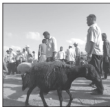
عرضه دام زنده در ۴ نقطه شهر گرگان