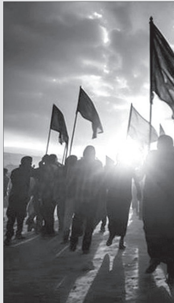
ی بین عرب و عجب سیاه و سفید نیدم که بین بندگان خدا تفاوتی هست

در سال سیزدهم خلیفه اول دار دنیا را وداع می کند و حکومت را به خلیفه ی دوم تحویل می دهد اما یک نکته ی مهم در این میان هست اول آنکه در دوران حکومت خلیفه ی اول فتوحات بزرگ اسلامی اتفاق نیفتاده است، همه می دانیم که فتوحات بزرگ اسلامی در دوران خلیفه دوم اتفاق افتاده است. آنچنان که محقق ارجمند میرزا حسین نایینی می گوید تاریخ اسلام