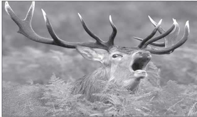
مرال از خانواده گوزن‌ها و از بزرگترین گونه‌های جانوران علفخوار و زیستگاه طبیعی آن جنگل‌های هیرکانی شمال کشور است