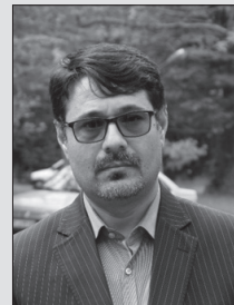
حسین دوست محمدی

دکتر مسعود پزشکیان رئیس جمهوری اسلامی ایران در بامداد چهارشنبه ۴ مهرماه ۱۴۰۳ در هفتاد و نهمین نشست سالیانه سران کشورهای عضو سازمان ملل متحد در صحن مجمع عمومی سخنرانی کرد. این سخنرانی حدود ۱۳ دقیقه زمان برد و رئیس جمهور متنی از پیش نوشته شده را قرائت کرد. صرف نظر از نوع اجرای ایشان که البته مسبوق به سابقه است و به اعتراف خود پزشکیان، ایشان در این زمینه خالی از نقص نیست و شرایط سالن، محتوای سخنرانی بسیار دقیق تنظیم شده بود و پیامهای جدیدی داشت که قطعاً به گوش آنها که باید بشنوند خواهد رسید، چه در سالن حاضر بوده باشند یا در جلسه سخنرانی رئیس جمهوری اسلامی ایران غایب باشند. این سخنرانی ابعاد گوناگونی داشت و هم در ادبیات این متن و هم پیامهای آشکار و پنهان آن می شد رگه های تغییر و بازبینی در راهبرد کلان کشور را مشاهده کرد. در این فرصت کوتاه تلاش می کنیم به برخی از موارد مهم این سخنرانی اشاره کنیم: