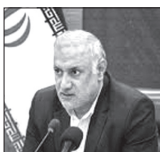
سرانه فضای ورزشی گلستان پایین تر از میانگین کشوری است