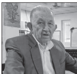
دوره‌می در کتابخانه ولی محمد خوجه