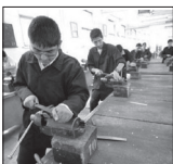
نمونه دولتی و مشکلی که ختم به خیر شد