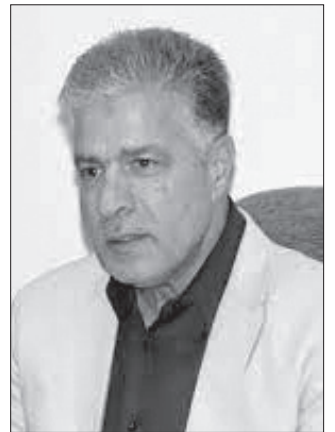
دکتر سید صادق حقیقت-استاد علوم سیاسی

چند قرائت از اسلام و فرهنگ به چشم می‌خورد: قرائت نخست «قرائت سنتی» است که عمدتاً در علمای سنتی ما دیده می‌شود. بسیاری از علمای سنتی ما اساساً دغدغه ارتباط با مدرنیته را ندارند. نه اینکه تجدیدستیز باشند، بلکه تجدیدگریز هستند. در حالی که یکی از ویژگی‌های نسل جدید این است که روی خوش به تجدید و مدرنیته نشان می‌دهد؛ بنابراین پاسخ سنتی به نسل جدید کفایت نمی‌کند.