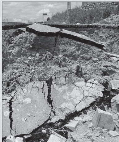
فرماندار کلاله گفت: فرونشست و رانش زمین در