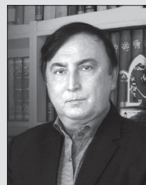
دکتر اراز محمد سارلی

مختومقلی فراغی است که در داخل ورودی، سمت چپ داخل قفسه شیشه‌ای قرار دارد. اینکه مجسمه مختومقلی در ابتدای ورودی گذاشته شده، نشانه‌ی بزرگداشت و اهمیت این شاعر ترکمن تلقی می‌گردد. درباره ابعاد مجسمه باید گفت که قد آن یک متر، عرض آن ۶۰ سانت و قطرش بطور متوسط ۲۵ سانتی متر است. جنس بکار رفته گچ، لعاب رنگ است. رنگ غالب بخاطر پوشش عبا، قرمز، رنگ قرمز می‌باشد و رنگ کلاه مشکلی است. برخلاف مجسمه جدید ترکمنستان که مختومقلی دارای دستار و عمامه است، این مجسمه مطابق الگوی طرح دوره شوروی سابق کلاه معمولی بر سر نشان داده شده است. درباره سازنده مجسمه اطلاعاتی در دسترس نمی‌باشد.