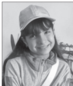
آرنیکا روح افزانی

کتاب ها، درونشان داستان ها و زندگی هایی در جریان است که خط به خطش درس ها و تجربه هایی به ما میدهند. شاید سال ها طول بکشد تا خودمان به آن برسیم. کتاب ها دوستانی هستند که هرگز ما را ترک نمی کنند و زمانی که کتابی می خوانیم و به پایان میرسانیم، میبینیم که حجم کتاب انگار بیشتر شده، گویی افکار و احساسات ما نیز درون تک تک صفحاتش در جریان است. کلماتی که در کتاب ها نوشته شده و ما آنها را زمزمه میکنیم، جادویی تر از هر جادوی دیگری است. کتاب ها و دنیای آنها مهم ترین و البته ناشناخته ترین اصل در دنیای ما است که می شناسیم. به نظر من دلیل اصلی اینکه بعضی کلمات و نوشته هایشان حرف دل ما را می زنند، این است که کتاب ها نبض و روح دارند. نویسنده نبض و روح را در تمام کلماتش جای داده است. زندگی ما هم به کتاب ها و دنیایشان می ماند.