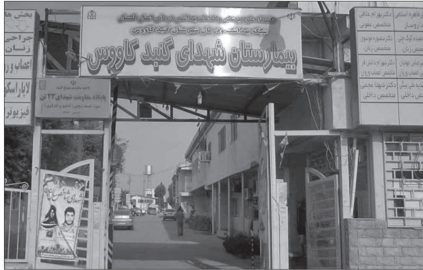
مراکز درمانی گنبد کاووس حداقل به ۸۰۰ تخت جدید نیاز دارند