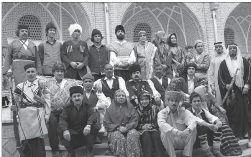
زبان مادری، حامل ارزش‌ها، باورها، سنت‌ها، ادبیات، هنر و علوم هر ملت است

والدین این حق را دارند تا آموزش و پرورش فرزندان خود را مطابق با ارزش‌های فرهنگی و زبانی خود انتخاب نمایند. این کنوانسیون همچنین تأکید دارد که دولت‌های عضو می‌بایست هرگونه تبعیض بر اساس نژاد، رنگ پوست یا زبان را ممنوع نمایند، زیرا یادگیری زبان مادری به عنوان ابزاری برای حفظ هویت فرهنگی و اجتماعی اقلیت‌ها در این زمینه اهمیت دارد. این پژوهشگر حقوق بین‌الملل کودکان در خصوص حمایت قانون اساسی از این حق کودکان گفت: قانون اساسی جمهوری اسلامی ایران، در اصل ۱۵ به صراحت بیان می‌دارد که زبان‌های محلی و قومی در رسانه‌های گروهی و آموزش و پرورش می‌بایست مورد توجه قرار گیرد. این اصل به حق کودکان برای یادگیری زبان مادری خود در مدارس اشاره دارد. در کشورهایی همچون کانادا و سوئیس، که جوامع چند زبانه هستند، قوانین خاصی جهت حمایت از حقوق زبان مادری کودکان تدوین شده است. در کانادا، قوانین ایالتی به مدارس این امکان را می‌دهد که برنامه‌های آموزشی را به زبان‌های مادری ارائه دهند. بسیاری از کودکان به ویژه در جوامع مهاجرپذیر با مشکلاتی در یادگیری زبان مادری خود مواجه هستند. این مشکلات شامل عدم دسترسی به منابع آموزشی، فشار برای یادگیری زبان‌های اصلی کشور و عدم حمایت نهاد خانواده‌ها از یادگیری زبان مادری می‌شود.