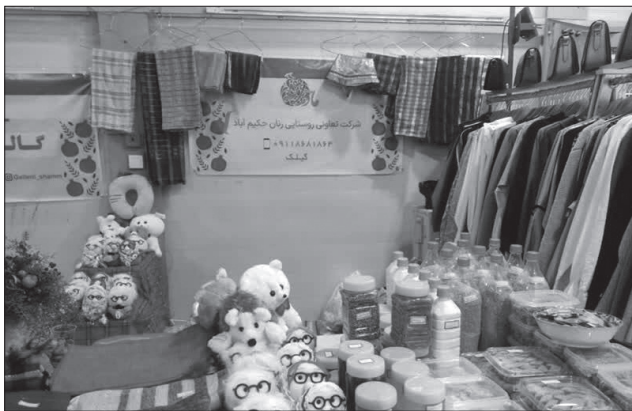
مسوولان دستگاه‌های دولتی به ویژه حوزه اقتصادی استان تسهیلات بانکی باسود کم در اختیار شرکتهای تعاونی فعال قرار دهند

روستا با در اختیار داشتن یک انبار هزار تنی، توانست سه هزار و ۶۰۰ تن گندم، ۶۲۰ تن دانه روغنی کلزا و ۵۲۰ تن سویا به عنوان مباشر مدیریت تعاون روستایی استان، از بهره برداران منطقه به طور تضمینی خریداری کرده و دست واسطه‌ها و دلالان را کوتاه کند. گیلک ادامه داد: برنامه توسعه انبار خرید محصولات کشاورزی یکی از برنامه‌های مهم این شرکت است که در صورت دریافت تسهیلات بانکی می‌توان آن را اجرا کرد و از طریق آن، طرح خرید محصولات کشاورزی مازاد بر نیاز بهره‌برداران منطقه را گسترش داده و امنیت خاطر برای تولید پایدار فعالان این بخش ایجاد کرد.