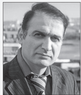
عباس فرهادی (لوکال)