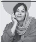
باغ وحش محدثه عوض پور

مرغ خیال سعدی مانند بسیاری از شاعران پرواز نیست بلکه واقع‌گرا نیز هست. گارسای‌ها و کچی‌های روزگار در آن، بازنه و مضامین اجتماعی را به فراوانی در حکایت‌ها و مثنوی‌ها منعکس کرده است. چنانکه دکتر غلامحسین یوسفی می‌نویسد: تصویر می‌کشد و در مقابل بوستان، ترسیب گلستان را که بخشی از آن نصحیه‌الملوک دانست. او در گلستان به آنچه هست و در بو