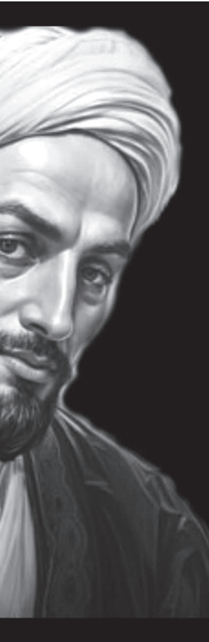
سید مهدی جلیلی

سعدی شیرازی، با نام کامل ابومحمد مشرف‌الدین مصلح بن عبدالله بن مشرف، یکی از بزرگ‌ترین شاعران و نویسندگان ادبیات فارسی است که در قرن هفتم هجری قمری (حدود سال ۶۰۰ تا ۶۱۵ هجری) در شهر شیراز متولد شد. او به دلیل سبک روان و زیبایی خود در نظم و نثر، به القابی همچون «شیخ اجل» و «پادشاه سخن» شهرت یافته است.