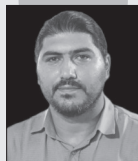
عطار به عطار، نظامی به نظامی صادق حاجتمند

باغ وحش شکسته دیوارش بی تو در کنج خلوت کافه قورت دام دوباره بغضم را در گلو بلند زرافه وسط جنگلی ترین حالم بوی هند تو در سرم پیچید تلخی قهوه توی خرطومم بی تو خیلی به طول انجامید ناگهان کافه را لگد زدم و اشکم افتاد توی فنجانم شور شد جرعه‌های آخر من در ته غبغب پلیکاتم به درخت بلند خاطرات دست انداخته دل خونم