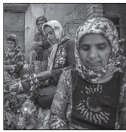
بایان خام فروشی پيله تر ابريشم